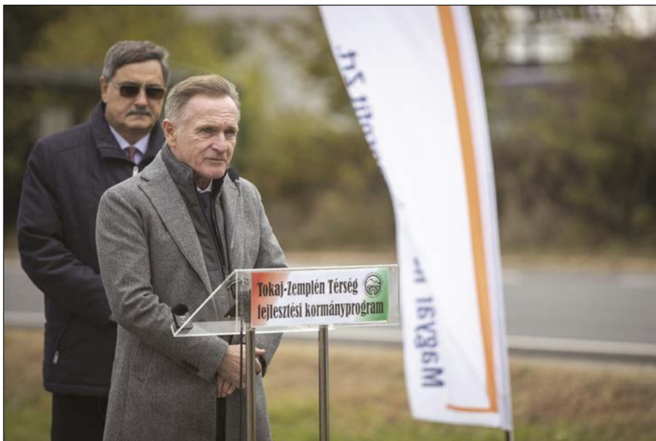
Wáberer György, Tokaj-Zemplén Térség fejlesztéséért felelős kormánybiztos a Sátoraljaújhely határában tartott sajtótájékoztatón.

Ezeknek a céloknak a valóra váltásához meg kell teremteni a hiányzó feltételeket – hangsúlyozta a kormánybiztos kijelentve, hogy azok között is kulcsfontosságú a térség megközelíthetőségének javítása, az úthálózat rendbetétele. Bár a térségben az elmúlt évtizedben is több mint 300 kilométer hosszban történt útjavítás, a közutaknak az egész régióra kiterjedő komplex rekonstrukciója nem halasztható tovább. A ma kezdődő és három évig tartó munkálatok a régió fejlesztésére rendelkezésre álló összeg több mint harmadát fedik le. Az úthálózat minőségének javítása