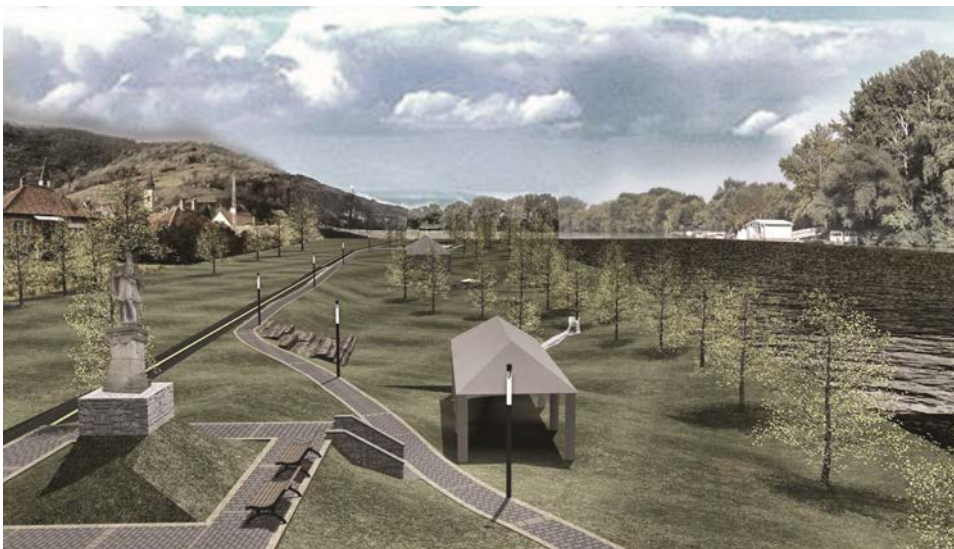
A Bodrog parti sétány egyik látványterve a mellette futó kerékpárúttal.

Olyan léptékű megújítás zajlik most a belvárosban, amire nagyon régen volt példa. Bízunk abban, hogy a munka eredményét az ide látogatók mellett a helyiek is elismerik majd.