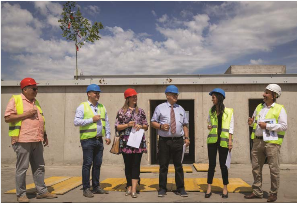
Bokrétáünnep a Tokaj Hotel tetején idén nyáron. Jövőre már vendégeket is fogadhat a négy csillagossá fejlődő hotel.