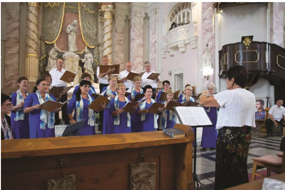
Koncert közben a Jézus Szíve templomban

Rövid ebédidő, tusolás, pihenés, beöltözés után 14 órakor a Jézus Szíve Templomban találkoztunk a Zalaegerszegi Városi Vegyeskarral. Ismerkedésre nem nagyon volt idő, mindkét kórus próbált, beénekelt, majd a közös énekhez álltunk fel. 15.30-ra hirdették meg a koncertet, és mi alig hittünk a szemünknek. A közönség egyetlen invitáló plakátra megtöltötte a templomot. Nálunk az adventi hangversenyre szoktak ennyien összegyűlni. A koncertet a házigazdák kezdték. Négy számot énekeltek, majd Tokaj Város Vegyeskara is felsorakozott, és a közös