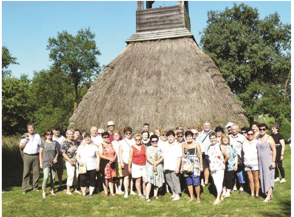
A "szoknyás" haranglábnál Pankaszon

A következő nap egy közeli étteremben kezdődött, ahol minden