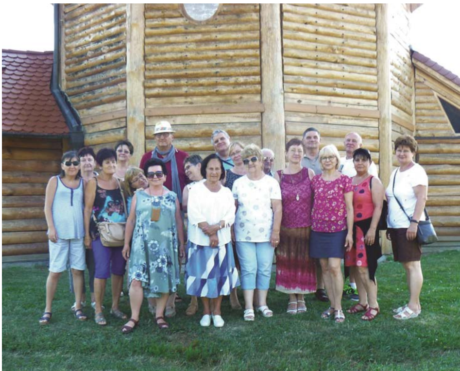
Hátunk mögött a "Noé Bárkája" templom Magyarföldön

Később hosszabban elidőztünk a Szalafő-Pityerszeren található skanzen házai között. Tanulságos volt látni, hogy a kicsi házakon alig volt nyílás. Tili-toli ablakocska szolgáltatva a fényt nappal, kémény nem volt, tehát a füst az ajtón távozott. A szegénység miatt minimális volt a helyiségek és berendezési tárgyak száma, agyagos, döngölt padló a lakóházakban. Annál nagyobb, néhol szebb is volt az állatok lakhelye, a termények és szerszámok tárolója, a fészker. Természetesen minden zsúpszalmával fedve, melynek szakértői voltak az egykori emberek. Ebédre betértünk a helyi büfébe, ahol olyan hagyományos ételeket kóstolhattunk, mint a dödölle, hajdina, vágányaleves. Kora délután még egy fazekas-házat is láttunk Magyarszombatfán , melyben beavattak a kerámiakészítés és -égetés rejtelmeibe. Nagy várakozással indulunk tovább Velemérre , ahol a közép-